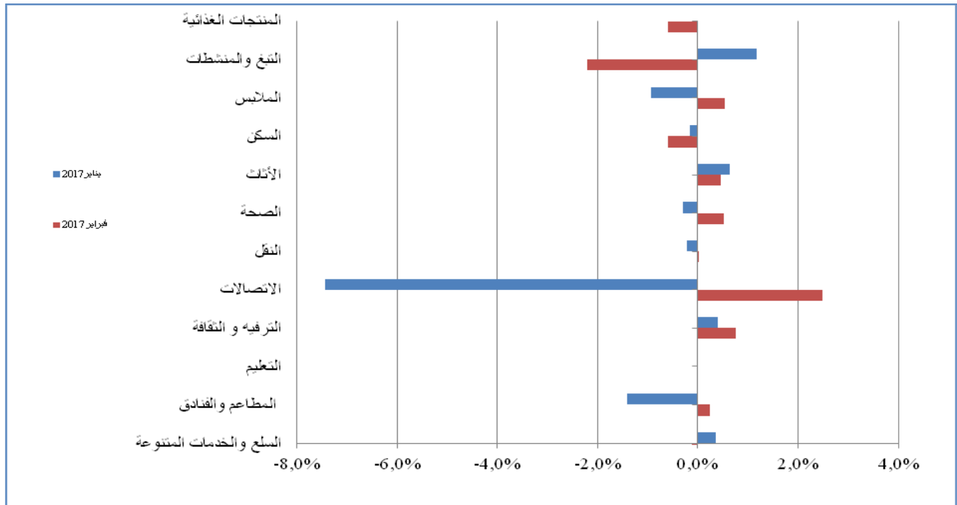
الرسم البياني 1 : تطور مؤشرات الوظائف في فبراير 2017